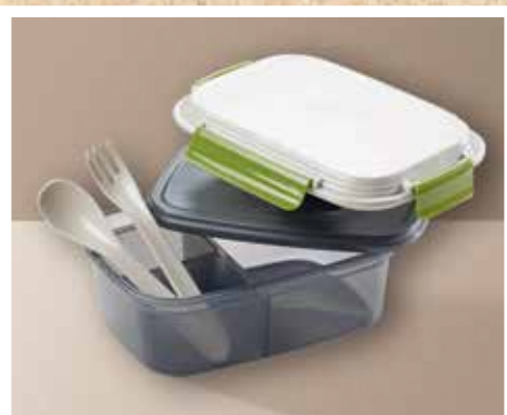
Lunch box spéciale micro-ondes avec couverts et rafraîchisseur Réf. CD199005 : 11,50 €