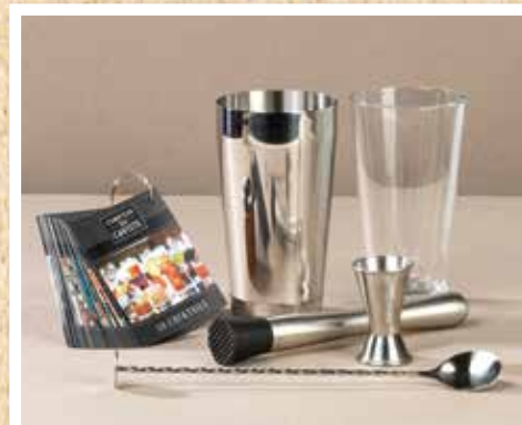
Set à Cocktails 5 accessoires et 50 recettes Réf. CD229608 : 20,00 €