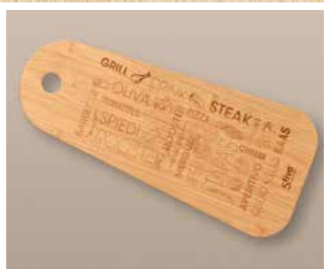
Grande planche apéritive en bambou (Dim. 45x20 cm) Réf. CD2321502 : 5,50 €