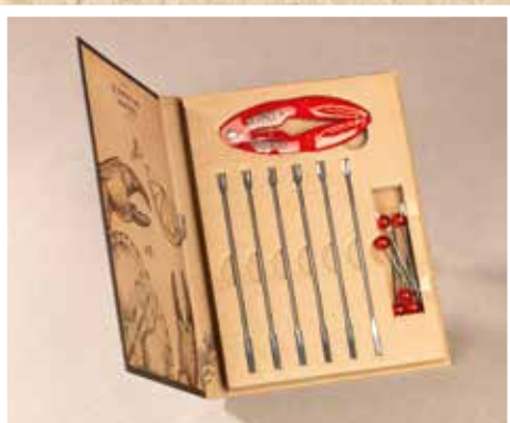
Coffret à Crustacés 13 accessoires Réf. CD219601 : 10,00 €