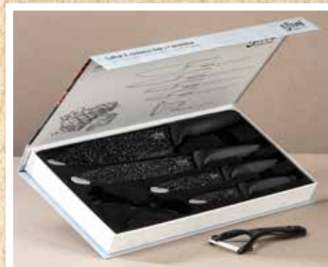
« Le Coffret du Chef » 4 couteaux inox & éplucheur céramique Réf. CD2221505 : 10,50 €