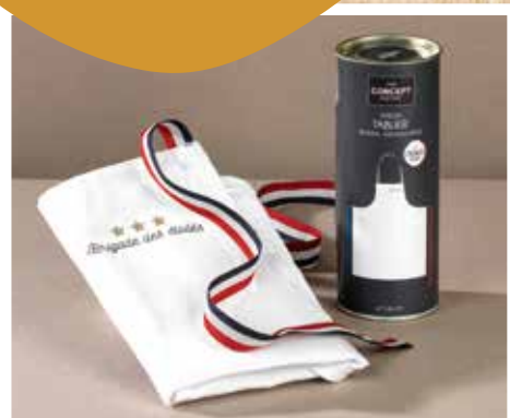
Tablier du chef coton « Brigade des étoilés » Réf. CD229610 : 6,90 €